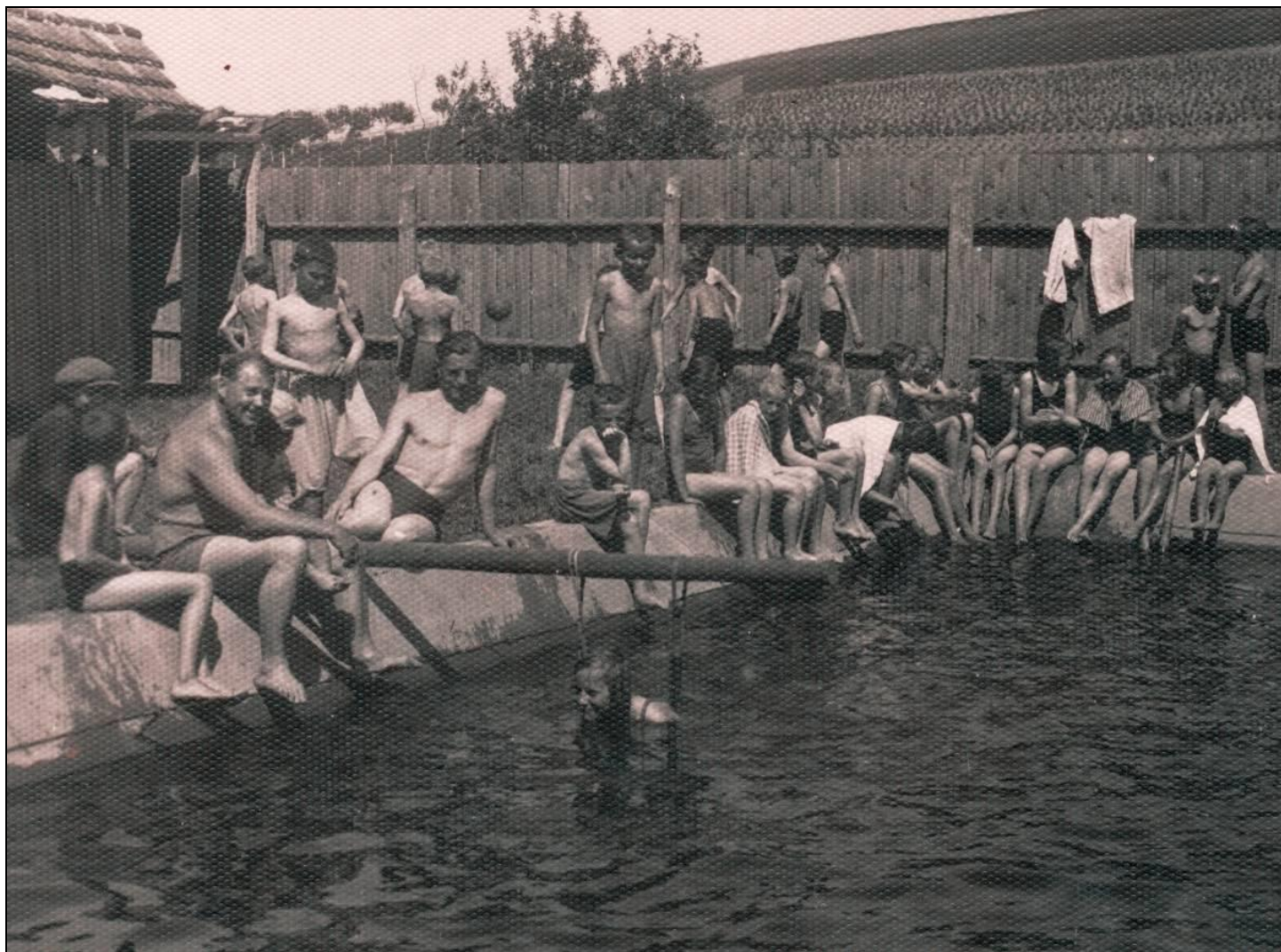
Léto na koupališti v Milešovicích (nad lihovarem, foto z 10.7. 1938)