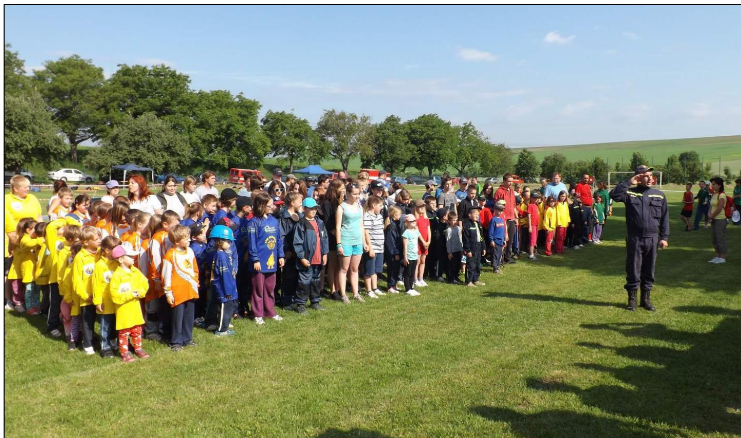
Hasičská soutěž - slavnostní nástup