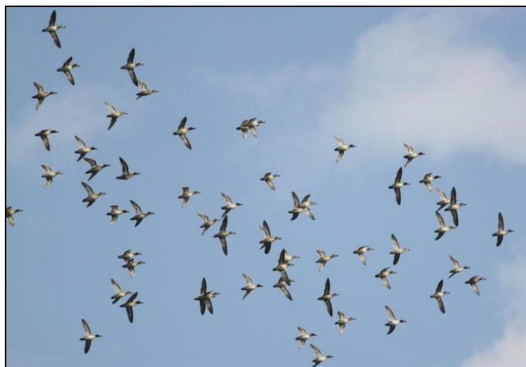
čírka obecná nad milešovickým mokřadem

Vídám zde lovit čápy černé , volavky popelavé i bílé a zaletuje sem moták pochop.