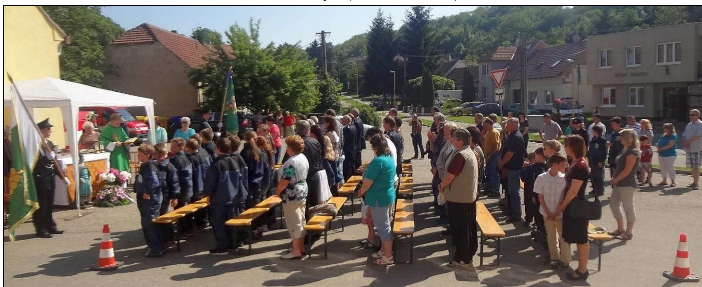
Slavnostní mše k 125. výročí založení sboru dobrovolných hasičů