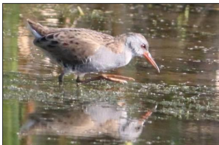
chřástal vodní na milešovickém mokřadu