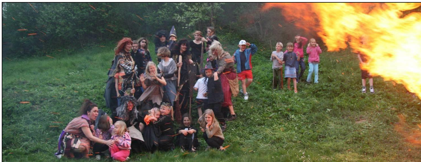
Pálení čarodějnic