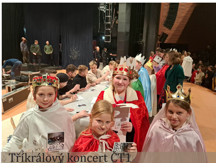
Tříkrálový koncert ČT1