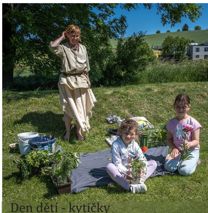
Den dětí - kyticky