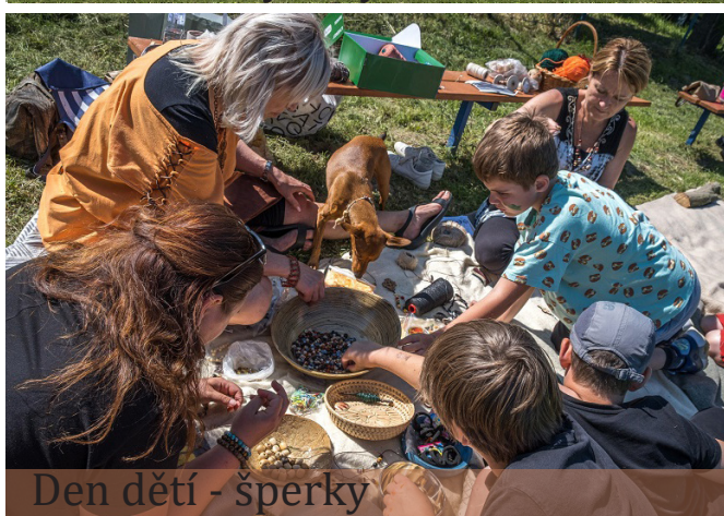
Den dětí - šperky