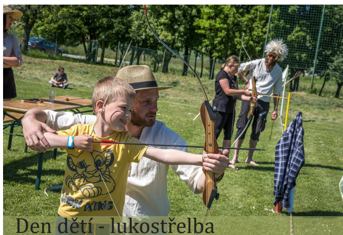
Den dětí - lukostřelba