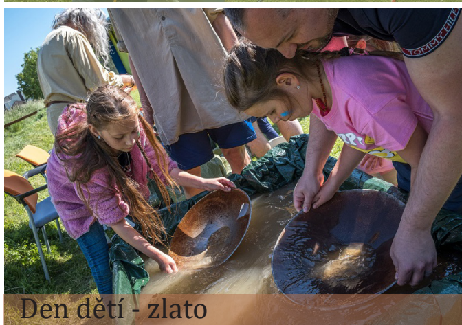
Den dětí - zlato